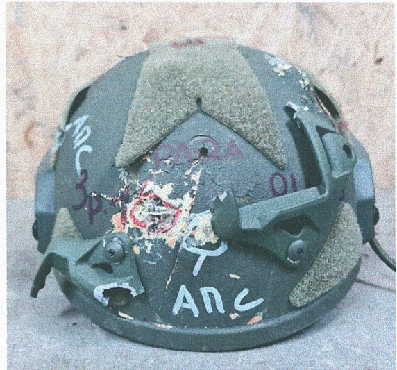
Фото зразка № 1 після випробувань