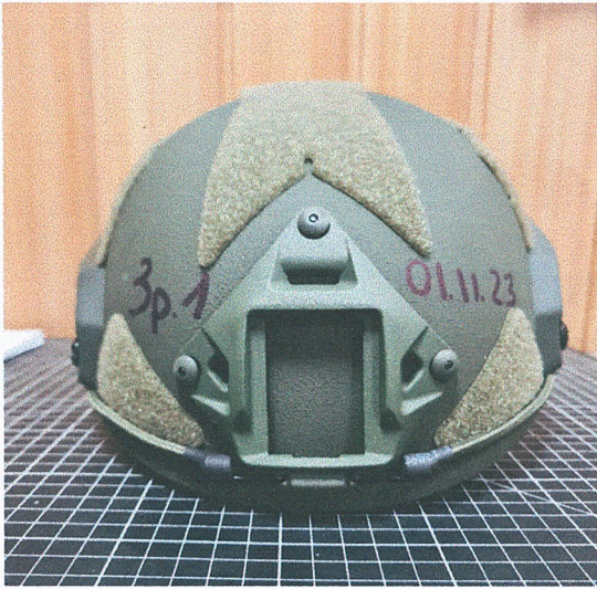
Фото зразка № 1 до випробувань